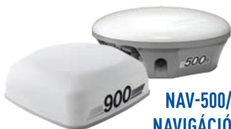
NAV-500/ NAV-900 NAVIGÁCIÓS VEZÉRLŐ